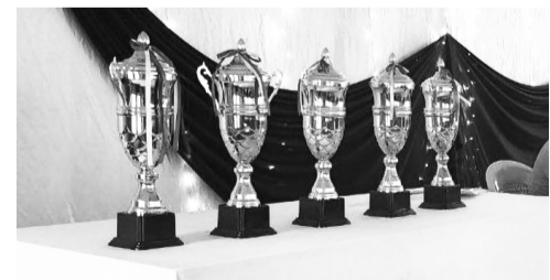
በተለያዩ የሞያ መስኮች ለማሰልጠን ቃል ገብተዋል።

የክረምት በጎ ፍቃድ ስራዎች ላይ ተሳታፊ ለነበሩ አካላት በአዲስ ከተማ ፖሊስ ጣቢያ አስተባባሪነት የምስጋና እና የእውቅና የሚጠቃለያ መድረክ ተካሄደ። የተከናወኑ በጎ ፍቃድ ስራዎች ካላቸው ማህበራዊ ፋይዳ ባሻገር የአካባቢውን ወጣቶች ከፖሊስ ጋር በሚገባ ያቀራረቡ እንደነበር በመድረኩ ተገልጿል።