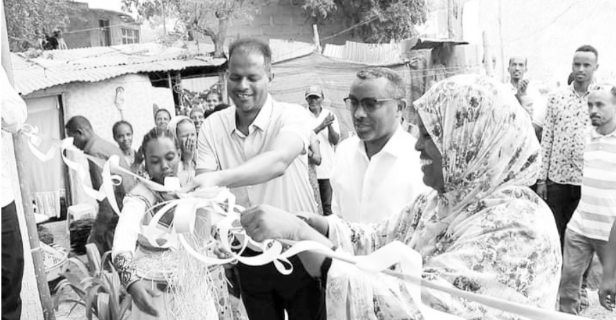
ጨምሮ የሁለት አቅመ ደካማ ቤቶችን በመገንባት አስረከቧል።

“በነነት ለኢትዮጵያ ክፍታ” በሚል እንደ አስተዳደር በክረምት በጎ አገልግሎት አማካኝነት በከተማ እና በገጠር አንድ መቶ የአቅም ደካማ ቤቶችን ለመገንባት አቅድ ተይዞ ወደ ትግበራ የተገባ ሲሆን በአስተዳደሩ ከሚገኙ የመንግስት መስሪያ ቤቶች መካከልም የአስተዳደሩ ትራንስፖርት እና ሎጂስቲክስ ባለስልጣን ወ/ሮ ዘነበችን