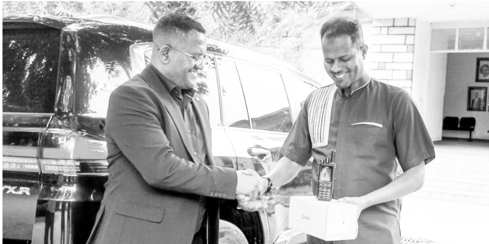
ያደረገው ድጋፍ በጋራ ሲተመን ከአንድ ሚሊዮን የሆነ የሬድዮ መገናኛ ድጋፍ ማድረግ ታውቋል። አምስት መቶ ሺ ብር በላይ የሚያወጣ ብዛቱ ሃምሳ