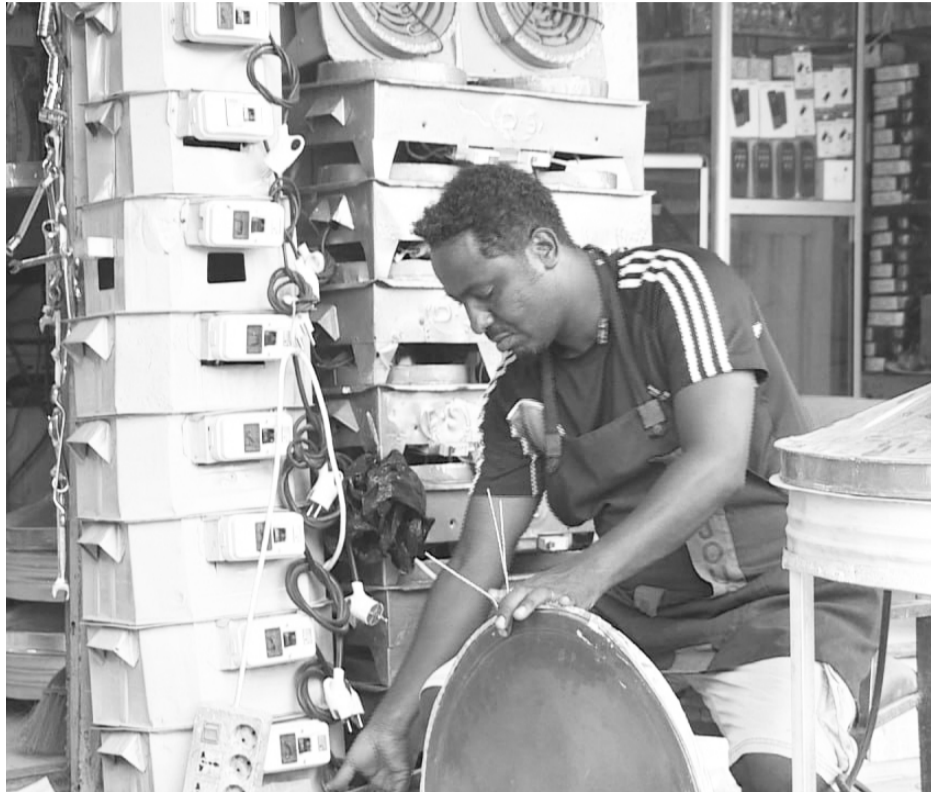
ፋይዳ የጎላ ነው።