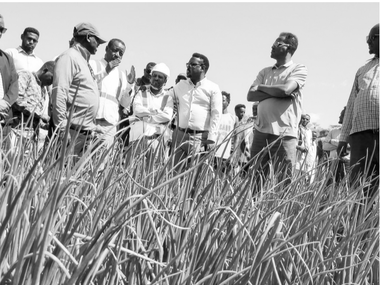
አጥረት በስፋት የሚታይባቸውን ወረዳዎች መሰረት በማድረግ መከናወኑ ጥቅሙን የጎላ እንደሚያደርገው ገልፀዋል።