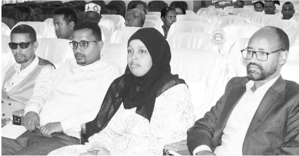
የመልካም አስተዳደር መርሆች ትግበራ ላይ በሚቀርቡ ሰነዶች ላይ በመወያየት ግብአት ሊሆኑ ሚችሉ ሀሳቦች እንደሚቀርቡ ያላቸውን እምነት ገልፀዋል።