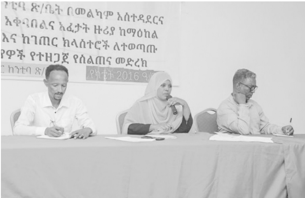
ለተሻለ ግልጋሎት እንዲሰሩ አሳስበዋል። በስልጠናው በገብረሰብ ሰርጌስና የሰው ሀብት ልማት ቢሮ በተሻሻለው የመልካም አስተዳደር መርሆች ትግበራ ላይ በሚቀርቡ ሰነዶች ላይ በመወያየት ግብአት ሊሆኑ ሚችሉ ሀሳቦች እንደሚቀርቡ ያላቸውን እምነት ገልፀዋል።