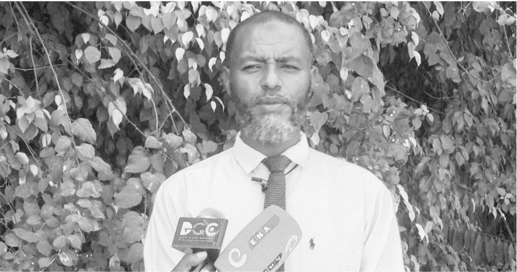
አንድንወጣና ችግሮችም ሲያጋጥሙ ከሚመለከተው የህግ አካል ጋር እንዴት በቅንጅት መስራት እንዳለብን ግንዛቤ የሰጠን ስልጠና ነው ያለው ሰልጣን የድሬደዋ ድል ጮራ ሪፈራል ሆስፒታል የውስጥ ኤዲተር ነው።

የመንግስትና የህዝብን ሀብት ለታለመለት ዓላማ ይውል ዘንድ ትልቁ ሞያዊ ኃላፊነትና እምነት የተጣለው በፋይናንስ ባለሙያዎችና የውስጥ ኤዲተሮች ላይ እንደመሆኑ ፤ ይህንን ኃላፊነታችንን በሙሉ አቅም