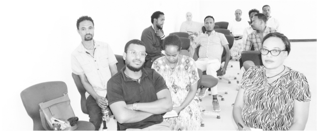
በድሬዳዋ እንደ አገር ለዘርፉ የተሰጠውን ትኩረት መሰረት በማድረግ የተለያዩ የድጋፍና ክትትል ስራዎች

እነዚህ አገራት ለአነስተኛና መካከለኛ የማኑፋክቸሪንግ ዘርፍ ለከፍተኛ ኢንዱስትሪዎች ጭምር ለምርት የሚያስፈልጉ ግብአቶችን እንዲያቀርቡ የሚያስችል የገበያ ትስስር የሚፈጥሩበት ሁኔታ በስፋት ይታያል።